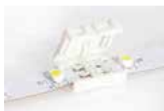
Skjøtekontakt El nr: 32 548 10